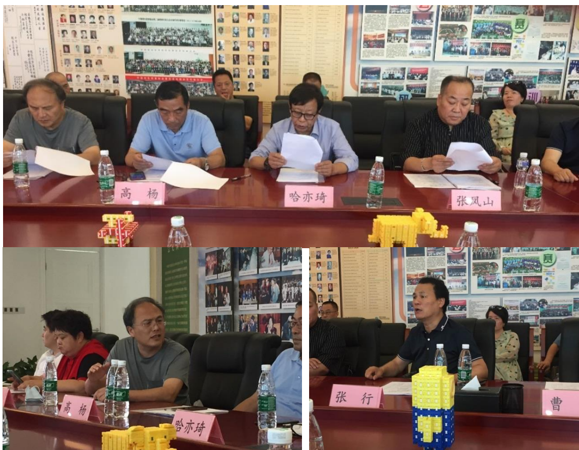
与会代表踊跃发言，集思广益研究工作思路和重点任务。