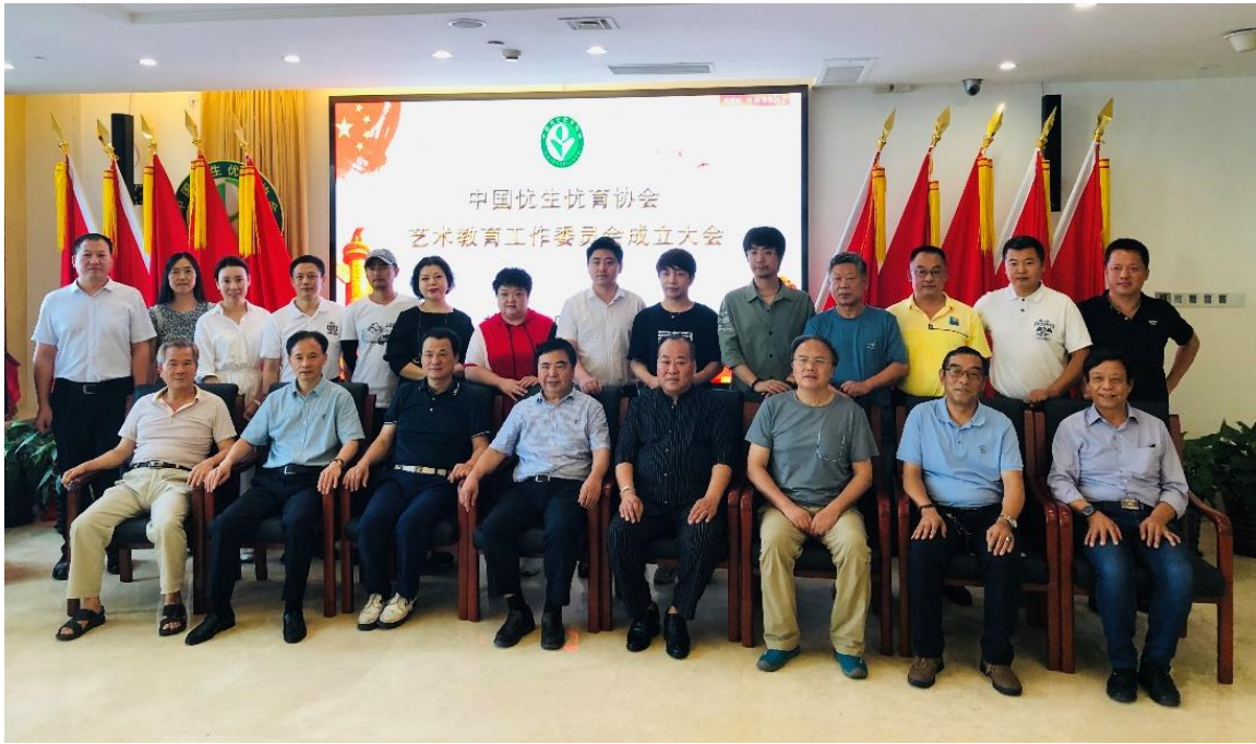
会后大家合影留念